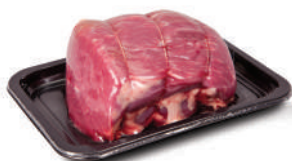
CZERWONE MIĘSO | POLIPROPYLEN