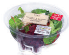
SAŁATKI | A-PET

Dostępne są różne rodzaje transformatorów, aby możliwe było korzystanie z urządzenia w krajach o różnych parametrach zasilania elektrycznego.